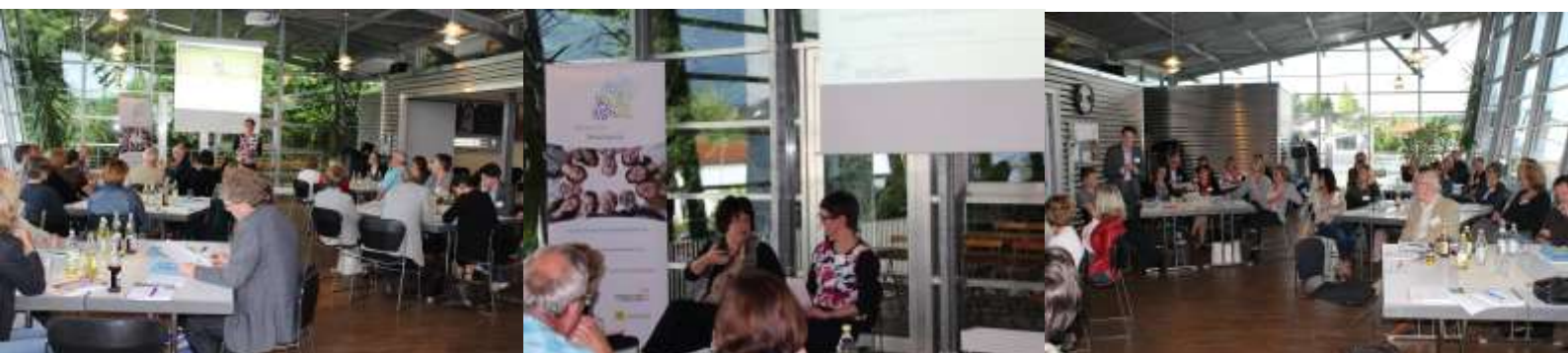
Bürgerbeteiligung in kleinen Städten und Gemeinden – Gesprächsabend mit Staatsrätin Erler, im Feuerwehrhaus in Engen.

Im Juli waren wir in Engen und haben gemeinsam mit der translake GmbH zu einem weiteren Gesprächsabend eingeladen. Die Themenschwerpunkte dieses Abends waren Bürgerbeteiligung in der Flüchtlingsarbeit, Zukunftsfragen und Leitlinien sowie Jugendbeteiligung in kleinen Städten und Gemeinden. Als Gast durften wir dieses Mal Giesela Erler, Staatsrätin für Zivilgesellschaft und Bürgerbeteiligung, begrüßen. Sie führte aus, weshalb die Landesregierung Baden-Württemberg Bürgerbeteiligung gerade in kleinen Städten und Gemeinden für wichtig hält und welche Ansätze sie unterstützen möchte.