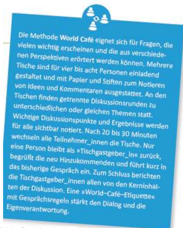
Blick ins Praxishandbuch